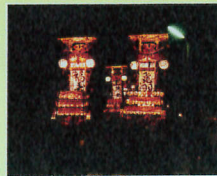
蛸島町祭礼のキリコ