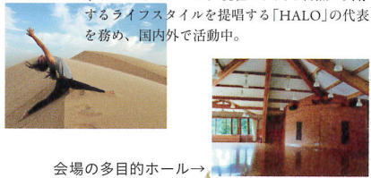
会場の多目的ホール→

[プロフィール] 石川県出身。2003年、単身ニューヨーク留学中にヨガに出逢う。ダイアナ紀の元専属セラピスト石川善光氏のもとで統合自然療法を学び、セラピストの経験を積む。2008年、恵比寿に隠れ家サロンをオープン。現在は、人と自然が共存するライフスタイルを提唱する「HALO」の代表を務め、国内外で活動中。